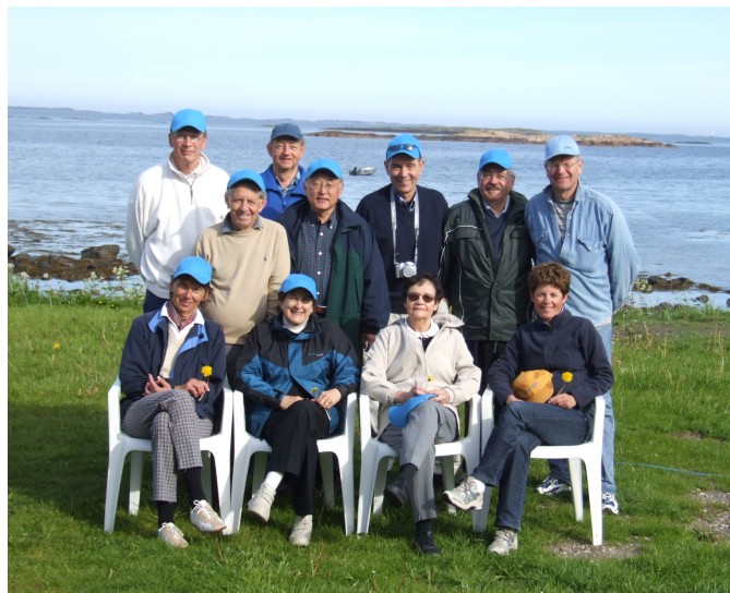
The IWA Council of Distinguished Water Professionals (June 2007)