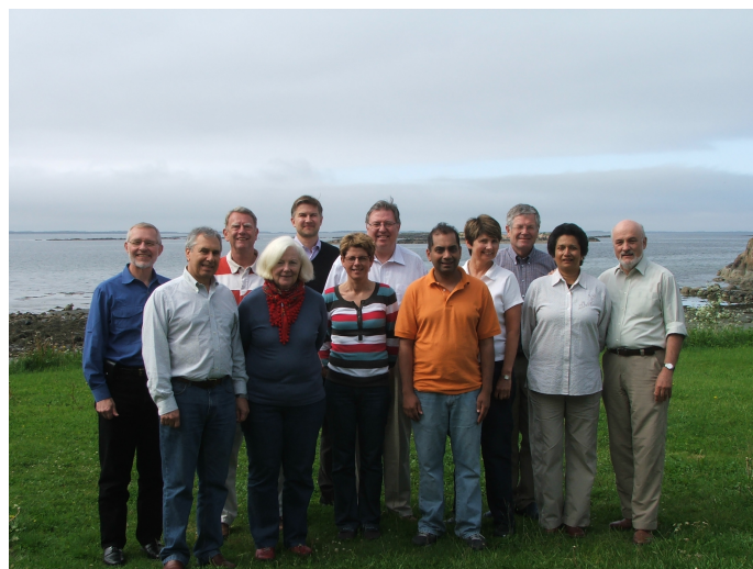
The IWA Innovation Program steering group (June 2011)