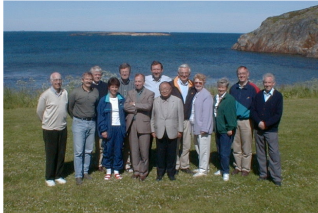
The managing committee of the IWA Specialist Group on Particle Separation (June 1999)